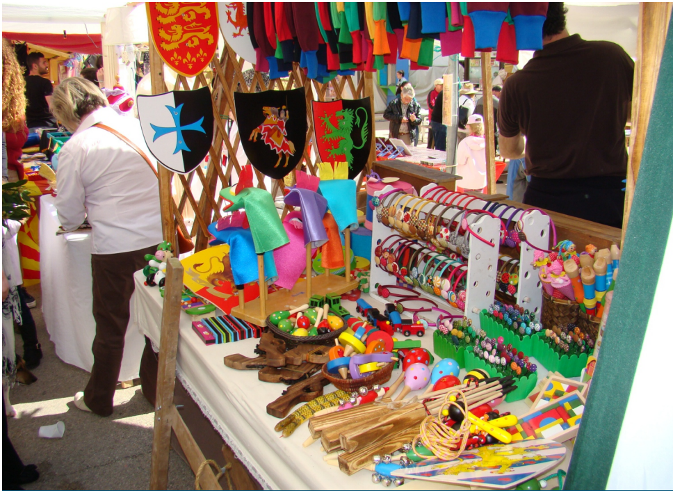
Fira Alternativa a l'Ametlla de Mar

Aquest divendres s'inaugura la 31a edició de la Fira Alternativa de l'Ametlla de Mar, la qual, s'allargarà fins a la tarda de diumenge.