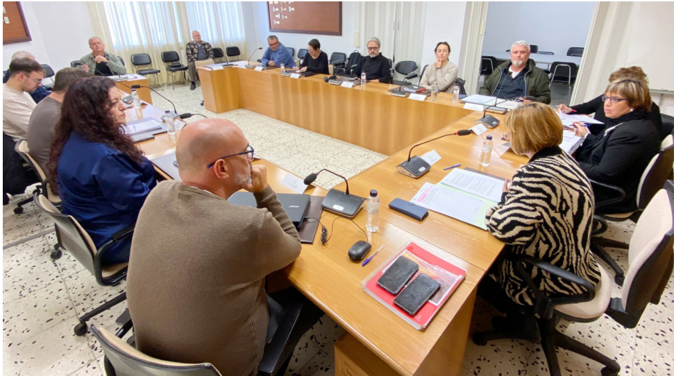
Ple de l'Ajuntament de l'Ametlla de Mar.

L'Ajuntament de l'Ametlla de Mar va aprovar aquest dijous en Sessió Extraordinària del Ple, el pressupost municipal per aquest exercici de 2024. Cal recordar que un esborrany d'aquest pressupost ha estat en els darrers mesos en mans del Ministeri d'Hisenda, el qual, ha fet una diagnosi dels requisits que ha de complir per poder ser aprovat, d'acord amb els compromisos adquirits per l'Ajuntament en matèria de deute.