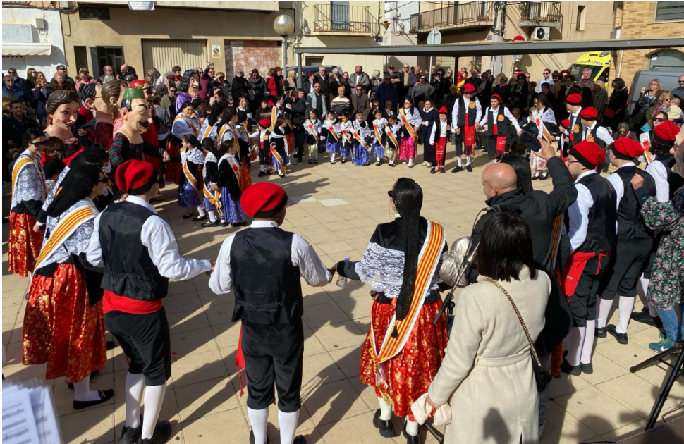
Gran ambient en totes les activitats de la festa.

El castell de focs d'artifici i un final de festa posterior al poliesportiu amb sessió de Dj, van posar el punt final aquest diumenge a la Candelera 2024 i a cinc dies d'activitats de tota mena i per a tots els gustos i edats.