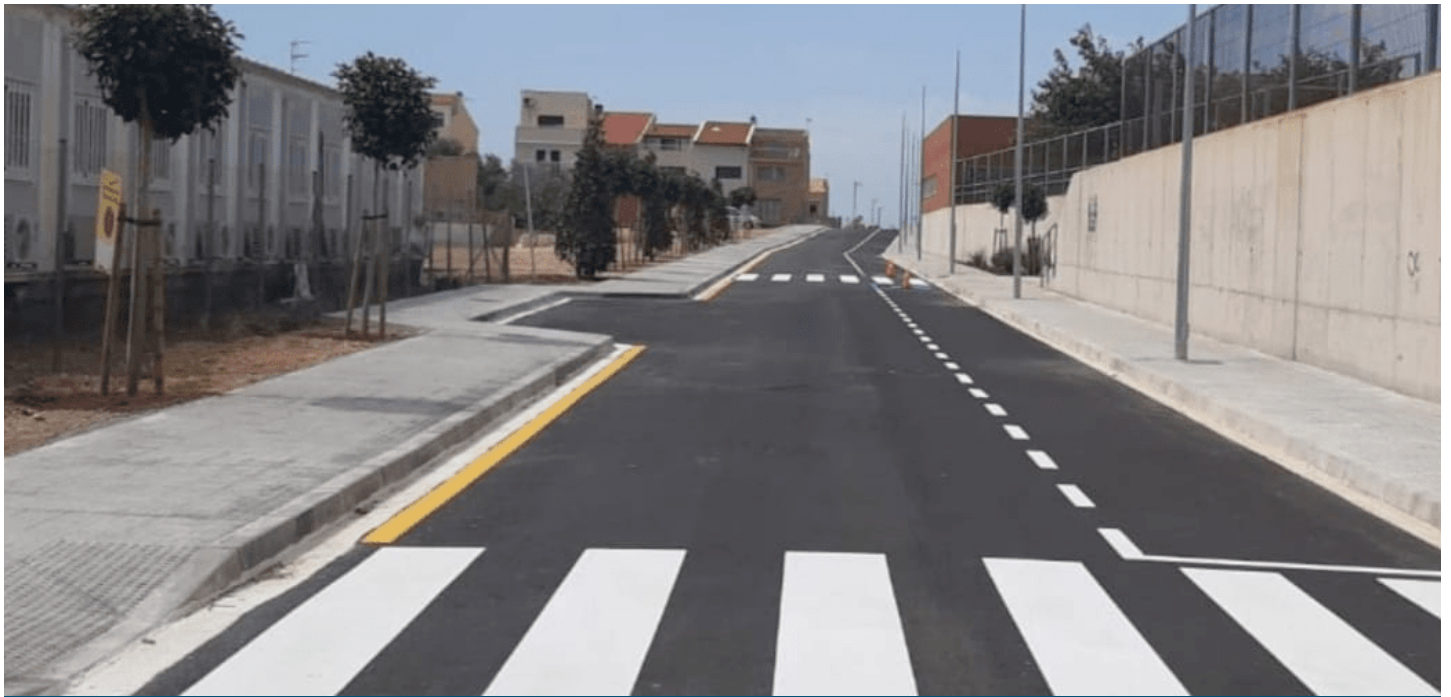
Nou vial del carrer Camarles.

Als pròxims dies, s'instal·larà la senyalització vertical i l'enllumenat.